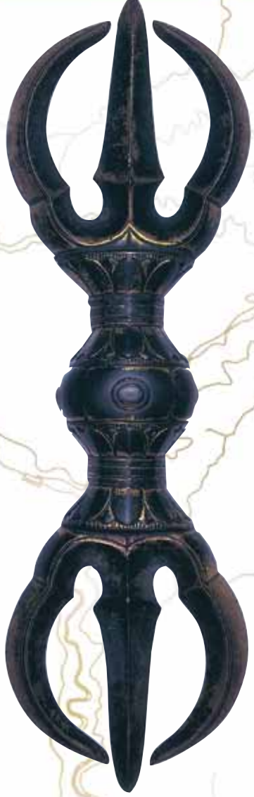
ตรีวัชระ อุปกรณ์ที่พระถือเมื่อประกอบพิธีทางศาสนาพุทธนิกายมหายานหรือวัชรยาน