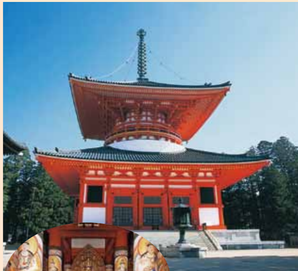
คองปองไดโตะ (เจดีย์หลัก) (Konpon Daito Pagoda)

ท่านโคโบไดชิ (ท่านคุโตะ) ให้สร้างขึ้นเพื่อเป็นศูนย์ปฏิบัติศาสนาพุทธนิกายวัชรยาน