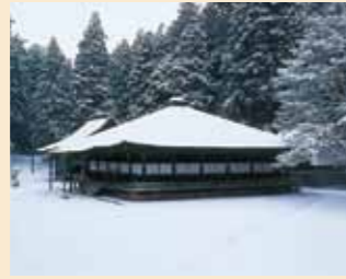
อาคารมื่อโคยะ (Mie-do Hall)

เจดีย์แห่งนี้ได้รับการบูรณะในปีค.ศ. 1937 และมีความสูงถึง 48.5 เมตร เป็นสัญลักษณ์ซึ่งแสดงถึงนิมิตวัชรยานได้อย่างดี