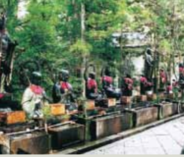
มิซุมุเกะ จิโซ (Mizumuke Jizo)

เส้นทางยาวกว่า 1.9 กิโลเมตรจากสะพานอิชิโนะฮะชิ สองข้างทางมีต้นสนใหญ่อยู่หลายร้อยปี และสูงกว่า 2 เมตรองค์ซึ่งรวมถึงสกลของโคโบเมียว (เจ้าเมือง) ชื่อตั้งของญี่ปุ่นเรียงเป็นแนว ด้านในเป็นสุสานของท่านโคโบไดชิ บริเวณนี้จึงเป็นที่ศักดิ์สิทธิ์ที่ผู้คนจำนวนมากเดินทางมากราบไหว้บูชา