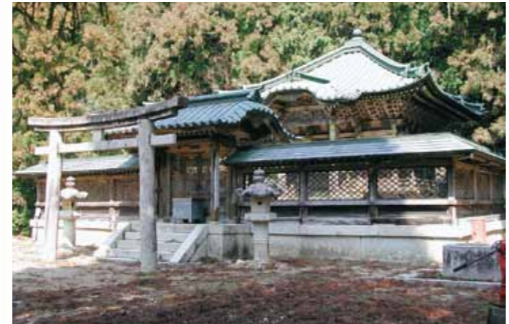
สุสานตระกูลโทกูงะวะ (Tokugawa Mausoleum) MAP-⑥

เนื่องจากโคยะซังเป็นสถานที่ศักดิ์สิทธิ์สำหรับฝึกปฏิบัติธรรม ผู้หญิงได้รับอนุญาตให้เข้ามาในบริเวณนี้ตั้งแต่ปีค.ศ. 1872 ในอดีต จึงมีการก่อสร้างอาคาร "นิยอนินโด" หรือ "หอบูชาสำหรับสตรี" ตรงทางเข้าสู่โคยะซังทั้งหมดเพื่อให้ผู้หญิงสามารถเข้ามากราบไหว้สวดมนต์ได้ ปัจจุบัน เหลืออาคารนิยอนินโดเพียงแห่งเดียว ชมให้น่ามาถึงสักครั้งสิเจ้าหญิงเวทมนตร์นี่เอง