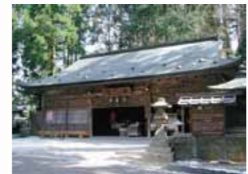
อาคารนิยอนินโด (Nyonin-do Hall) MAP-⑤

ในปีค.ศ. 1593 ท่านโชกุนโตโยโตะ อิเคฮะชิโรสร้างวัด "เซ็งจิ" ขึ้นเพื่อเป็นการทำบุญให้แก่บรรดาที่เสียชีวิต ในปีค.ศ. 1869 วัดนี้ได้รับการสถาปนาให้เป็นวัดหลักในโคยะซัง และเปลี่ยนชื่อเป็นวัด "คองโกบุจิ" ปัจจุบัน วัดเป็นศูนย์กลางของนิกายวัชรยาน และสาขากว่า 3,600 สาขาทั่วประเทศ