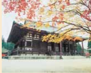
อาคารกงโด (Kon-do Hall)

ท่านโคโบไดชิสร้างอาคารขึ้นเพื่อบรรจุพระพุทธรูปบูชา และเป็นสถานที่สำหรับสวดมนต์ภาวนา อาคารปัจจุบันเป็นอาคารที่ถูกรื้อถอนในปีค.ศ. 1848 หลังคาที่มีมุมนลาดเอียงหลังคาทำให้อาคารดูอ่อนช้อยสวยงาม เป็นเอกลักษณ์