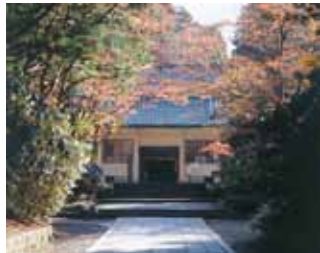
พิพิธภัณฑสถานเรโฮกัน (Reihokan Museum) MAP-②

ประตูหลักสู่เขตโคยะซัง ได้รับการบูรณะในปีค.ศ. 1705 ตัวประตูถูกสร้างจากแผ่นไม้ 2 ชั้น มีความสูง 25.1 เมตร โดยมีเทพเจ้าผู้ปกป้อง "คองโกริซึชิ" ยืนอยู่ทั้ง 2 ด้าน