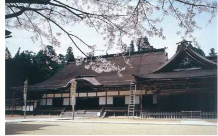
วัดคองโกบุจิ (Kongobu-ji Head Temple) MAP-④

ในปีค.ศ. 1593 ท่านโชกุนโตโยโตะ อิเคฮะชิโรสร้างวัด "เซ็งจิ" ขึ้นเพื่อเป็นการทำบุญให้แก่บรรดาที่เสียชีวิต ในปีค.ศ. 1869 วัดนี้ได้รับการสถาปนาให้เป็นวัดหลักในโคยะซัง และเปลี่ยนชื่อเป็นวัด "คองโกบุจิ" ปัจจุบัน วัดเป็นศูนย์กลางของนิกายวัชรยาน และสาขากว่า 3,600 สาขาทั่วประเทศ