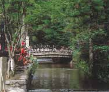
สะพานโกเบียวบาชิ (Goby no hashi Bridge)

ตรงทางขึ้นสะพานโกเบียวบาชิ มีรูปปั้นจิโซ (พระโพธิสัตว์ผู้พิทักษ์เด็ก) ขนาดใหญ่เรียงรายอยู่ ชาวญี่ปุ่นมักมากราบไหว้ที่เพื่ออนุโมทนาบุญแก่บรรพบุรุษ