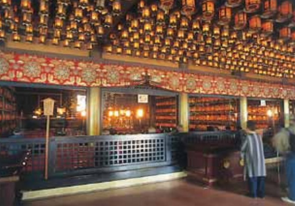
อาคารโทโรโด (Toro-do Hall)

เมื่อข้ามสะพานนี้ ถือว่าท่านได้ก้าวเข้าไปในดินแดนศักดิ์สิทธิ์ของท่านโคโบไดชิ ด้านหลังป้ายจารึกชื่อพระพุทธรูปทั้ง 37 องค์แห่งโลกตะ (the Diamond World)