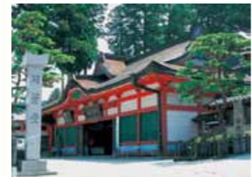
อาคารคารุกะโยโด (Karukaya-do Hall) MAP-⑦

ก่อสร้างขึ้นตามคำสั่งของท่านโชกุนโทกูงะวะ อิเอมิตสึในปีค.ศ. 1643 และใช้เวลาสร้างถึง 20 ปีกว่าจะเสร็จสมบูรณ์ ภายในสุสานเป็นสิ่งของล้ำค่า ตกแต่งอย่างประณีตละเอียดลออเพื่อแสดงความเคารพต่อท่านโชกุนโทกูงะวะ อิเอะยะซุ และท่านโชกุนโทกูงะวะ อิเอะตะคะ