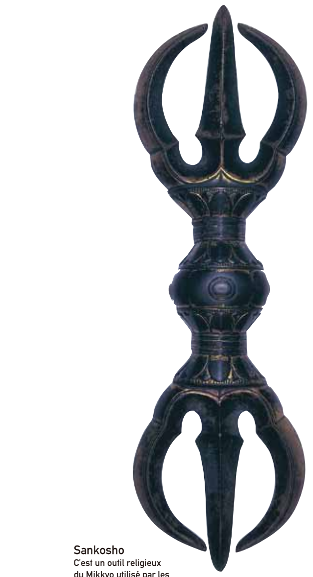
Sankosho C'est un outil religieux du Mikkyo utilisé par les bonzes lors de la pratique religieuse

On peut louer des audioguides qui offrent un soutien linguistique en japonais, anglais, français, chinois et coréen, à l'association Shukubo.