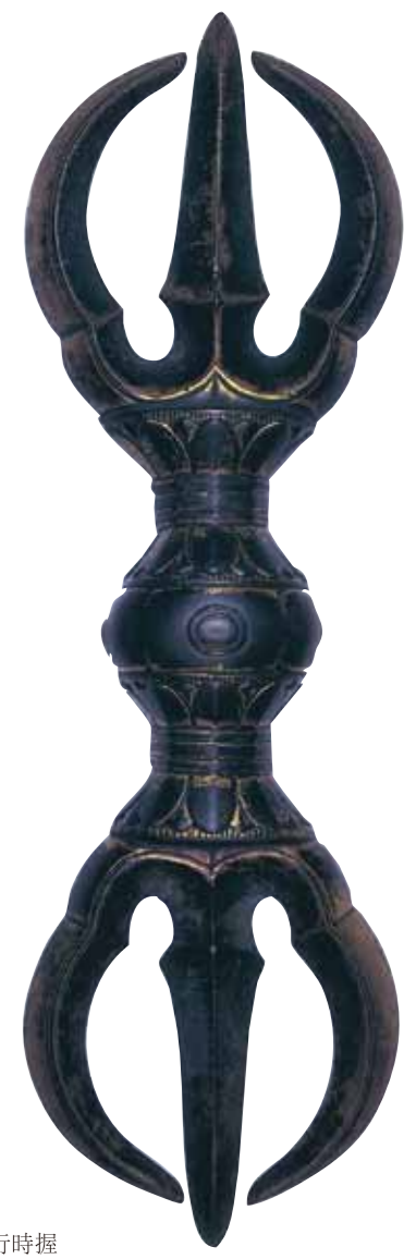
三鈷杵 是僧侶修行時握在手中的密教法具